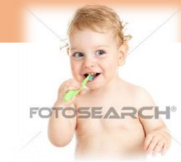
ร้อยละเด็ก 3 ปี ปราศจากฟันผุ (5/03/63)