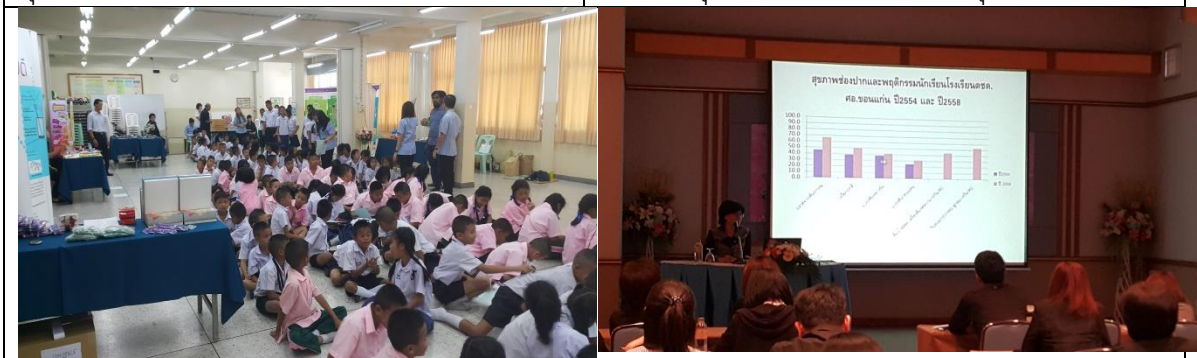
จัดบูชกิจกรรรมฐานการเรียนรู้ในโรงเรียนในโครงการตามพระราชดำริฯ สังกัดกทม.ร่วมกับกรมคร.