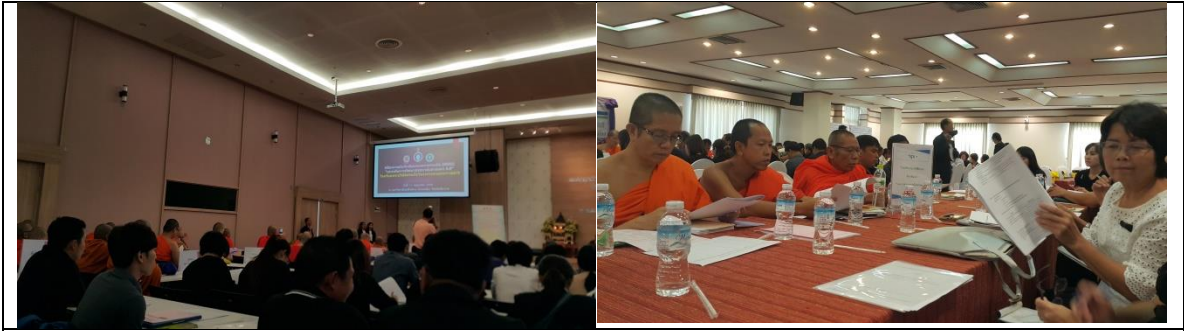
ร่วมประชุมและวิทยากรกลุ่มในการประชุมพัฒนาสาขาภิบาลอนามัยสิ่งแวดล้อมโรงเรียนพระปริยัติธรรม ตามโครงการพระราชดำริฯ (กพด)