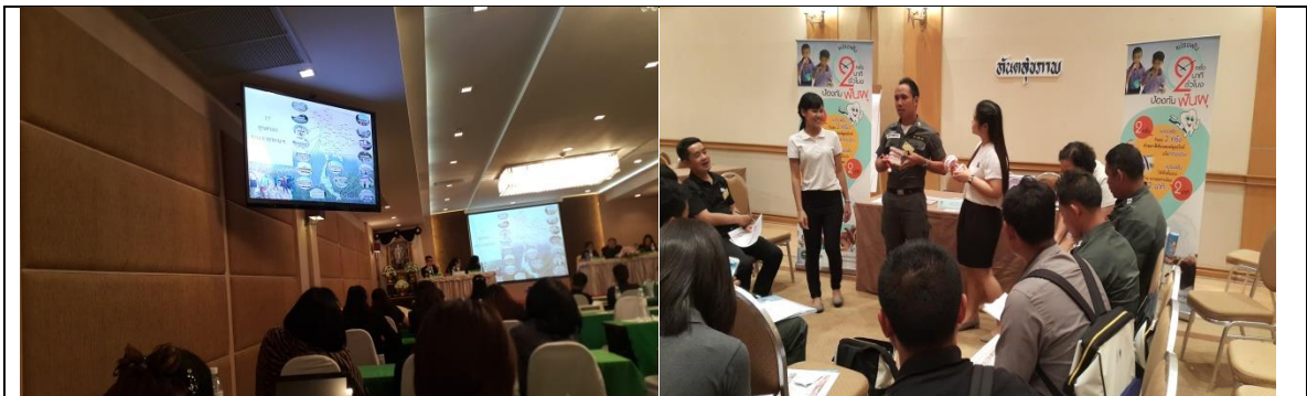
ร่วมจัดทำแผนพัฒนาเด็กและเยาวชนในถิ่นทุรกันดาร(กพด) ปี ๒๕๖๐-๒๕๖๔