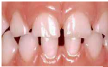
ฟันสะอาด ผิวฟันเรียบเป็นมันวาว

การตรวจความสะอาด ครู/ผู้ดูแลเด็ก ตรวจฟันเด็กไปพร้อมกับการตรวจสอบสุขภาพทั่วไปหรือตรวจภายหลังที่เด็กแปรงฟันแล้ว โดยใช้หลอดพลาสติกเล็กๆ ปลายตัดมน เช็ดดูคราบจุลินทรีย์บนผิวฟัน ฟันที่สะอาดจะต้องไม่มีคราบติดออกมากับปลายหลอด หากพบว่ามีคราบติดออกมากับปลายหลอด แสดงว่ายังแปรงไม่สะอาด ครู/ผู้ดูแลเด็กต้องแปรงซ้ำ ฝึกทักษะการแปรงฟันให้เด็กเพิ่ม และแนะนำให้ผู้ปกครองแปรงฟันเด็กที่บ้านทุกวัน