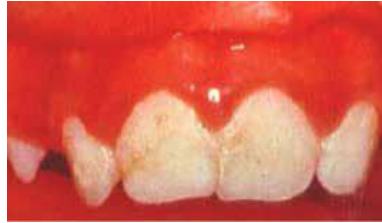
ฟันไม่สะอาด มีคราบจุลินทรีย์