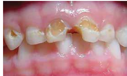
ฟันหน้าผุเป็นรู