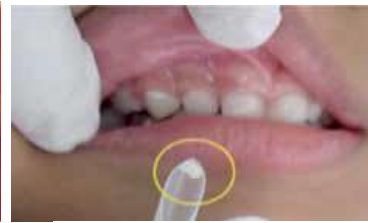
ใช้หลอดพลาสติกเช็ดดูคราบจุลินทรีย์

การตรวจฟันผุและบันทึกการตรวจ ควรตรวจเทอมละ ๑ ครั้ง หรือทุก ๖ เดือน หากพบว่าฟันมีรอยขาวขุ่น หรือ สีดำ หรือเริ่มมีรูผุ ควรแนะนำผู้ปกครองให้พาเด็กไปพบทันตบุคลากร