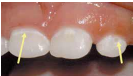
ฟันเริ่มผุ เห็นผิวเคลือบฟันเป็นรอยขาวขุ่น

การตรวจฟันผุและบันทึกการตรวจ ควรตรวจเทอมละ ๑ ครั้ง หรือทุก ๖ เดือน หากพบว่าฟันมีรอยขาวขุ่น หรือ สีดำ หรือเริ่มมีรูผุ ควรแนะนำผู้ปกครองให้พาเด็กไปพบทันตบุคลากร