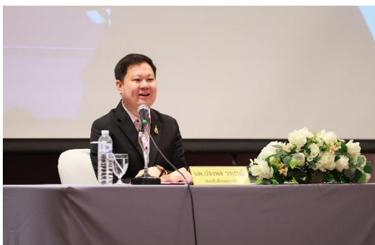
นายแพทย์ปองพล วรปานิ รองอธิบดีกรมอนามัย ประธานพิธีเปิดการประชุม

5. ผลการดำเนินการการประชุมเชิงปฏิบัติการพัฒนาศักยภาพการจัดบริการสุขภาพช่องปากของบุคลากรสาธารณสุขที่ปฏิบัติงานในคลินิกฝากครรภ์คุณภาพและคลินิกเด็กสุขภาพดี วันที่ 28 มกราคม 2568 ณ โรงแรม ทีเค. พาเลซ แอนด์ คอนเวนชั่น และผ่านระบบประชุมทางไกล (Video conference)