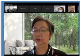
ทพญ. ปิยะดา ประเสริฐสม ที่ปรึกษากรมอนามัย

สิ่งที่ดำเนินการต่อ : จัดทำหนังสือแจ้งดำเนินการคัดกรองให้บริการและบันทึกข้อมูลในระบบเฝ้าระวังและกำกับติดตามความก้าวหน้าจังหวัดในการดำเนินงาน