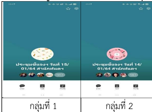
กลุ่มที่ 1